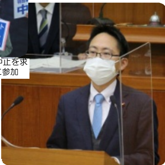
区議会本会議場で一般質問