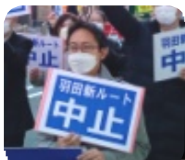
羽田新ルート中止を求めるパレードに参加