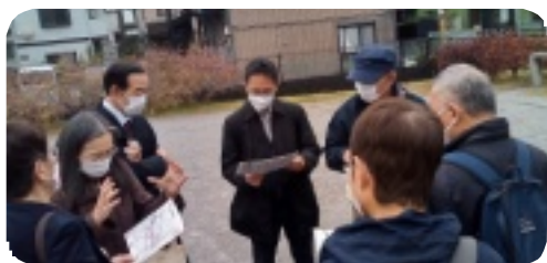
外環道陥没現場を視察