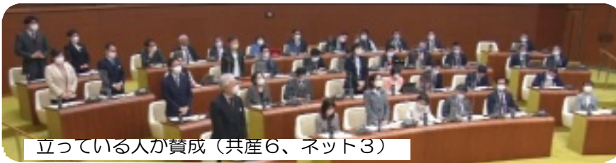
立っている人が賛成（共産6、ネット3）