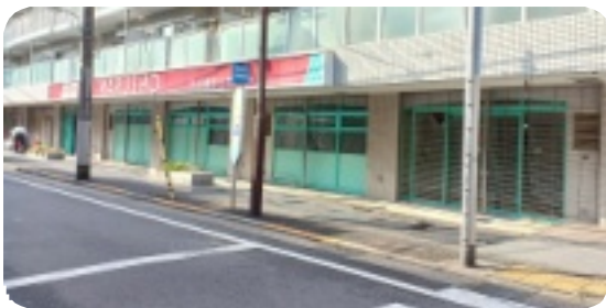
▲二葉1丁目の元丸正。今では何もなくなっていました。

地域のスーパーマーケットが閉店に追い込まれています。二葉1丁目にあった丸正が昨年末に閉店しました。地域の方からは「生鮮食品を買うところがない」との声も。跡地にはスギ薬局が入るとの噂です。