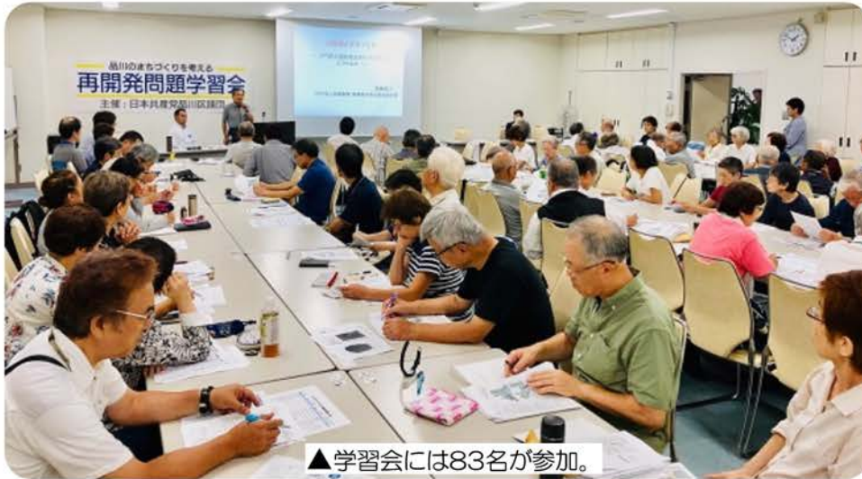
▲学習会には83名が参加。