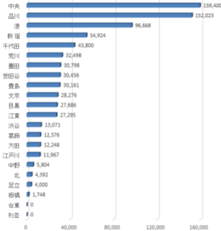
再開発に投じられた補助金総額の23区比較

区内で問題になっており、み続けられるまちづくり 武蔵小山や大崎、大井町、をめぐす品川区民の会」 戸越公園などの駅周辺再 開発で周辺住民だけな 益のためのまちづくりで が広がっています。 なく、住民合意のまち づくりを求める活動が広 8つの住民団体が「住 がっています。