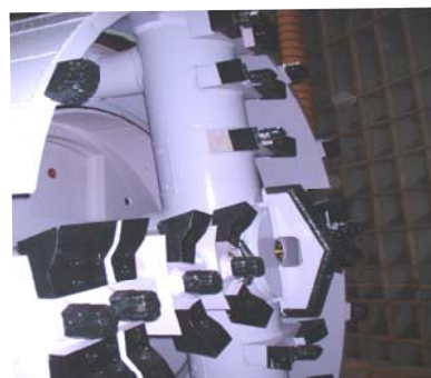
(シールドマシンの先端)