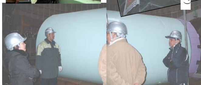
(立坑の中・地下20mで責任者から説明を聞く)