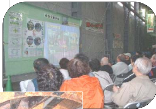
↑ 工事の説明を受ける

6月30日、中延2〜6丁目の水害対策として行われている下水道工事(シールド工事)の現場見学会に地域の方々と一緒に参加しました。水害対策の工事説明を受け、実際に700mまで掘り進んだトンネルの200m地点まで入って中を見せていただきました。