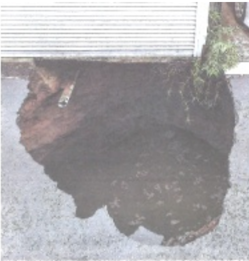
外環道本線トンネル工事の直上で起きた陥没。民家のガレージトキをえり、底には大量の水がたまっていました。20年10月18日午後2時すぎ、品川区

現在の区内工事の進捗状況は？ 起点となる北品川の立て坑工事が終了し、トンネルを掘り進めるシールドマシンの組み立てがほぼ完成。外環道の陥没